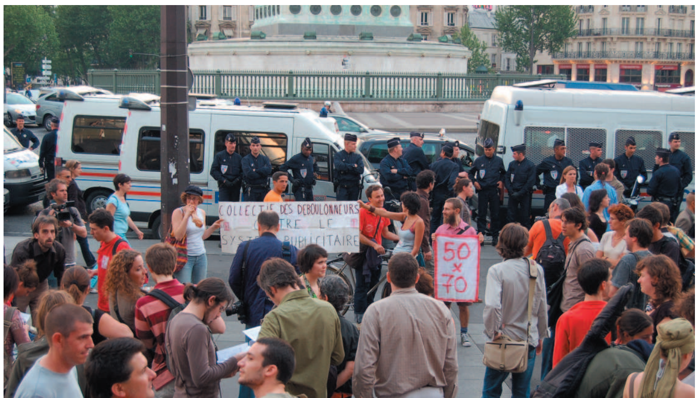
Parijs, Activisten van het collectief Les Déboulonneurs aan de trappen van Opéra La BastilleSwank

Recent werden enkele Barbouilleurs in Parijs veroordeeld tot 1 euro boete per persoon. De rechter vond hun acties symbolisch en eerder licht van aard. Deze overwinning sterkt hen om met hun acties door te gaan.